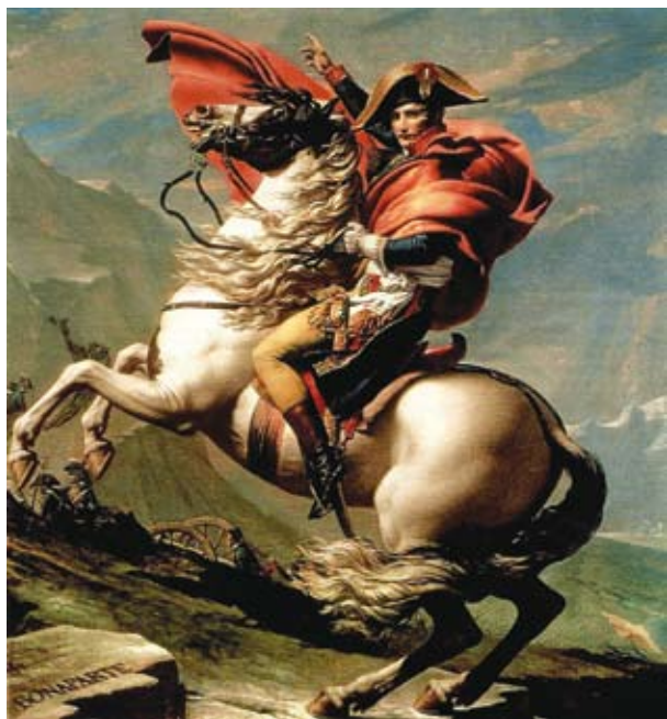
Obrázok 1: Napoleon Bonaparte