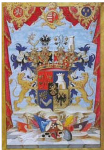
Obrázok 4: Erb Hadikovcov

armáde v Porýnsku i Taliansku. Talianska výprava vyvrcholila zdrvivúcou porážkou habsburskej armády 14. júna 1800 v bitke pri Marengu, a to napriek tomu, že 30-tisícová habsburská armáda mala značnú početnú a spočiatku aj výraznú taktickú prevahu. O výsledku bitky rozhodol príchod divízie generála Louisa Desaix, ktorý silným úderom do nekrytého boku habsburských vojsk zvrátil víťazstvo vo francúzsky prospech. Habsburská armáda v bitke stratila 6000 padlých a ranených a 7000 mužov bolo zajatých. Následkom ťažkého zranenia zakrátko podľahol aj 44-ročný levočský rodák podmaršal Karol Hadik, syn maršala Andreja Hadika. V bitke velil jednému z habsburských zborov. Ešte v prvej koalícnej vojne mu cisár udelil rytiersky i veliteľský kríž Radu Márie Terézie.