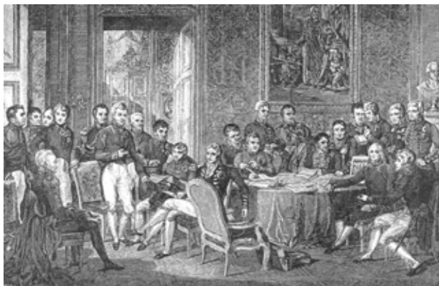
Obrázok 7: Účastníci Viedenského kongresu

Koncom decembra 1813 prekročil maršal Schwarzenberg na čele hlavnej armády Rýn a 30. marca 1814 vstúpili spojenecké vojská do Paríža. Napoleon Bonaparte musel abdikovať. Dňa 30. mája 1814 už mier v Paríži uzatváral bourbonský kráľ Ľudovít XVIII. Tento mier navracal Francúzsko do hraníc z roku 1792. Usporiadanie Európy po skončení napoleonských vojen sa prerokovalo na svetovom kongrese vo Viedni, ktorý zasadal od októbra 1814 do júna 1815. Epilógom vojnového dvadsaťročia v čase rokovania Viedenského kongresu sa stalo tzv. stodňové cisárstvo, keď sa Napoleon po úteku z ostrova Elba od marca do júna 1815 opäť zmocnil vlády vo Francúzsku, takže definitívnou vojnovou bodkou bola až Napoleonova porážka 18. júna 1815 v bitke pri Waterloo, v ktorej však habsburská armáda nebojovala.