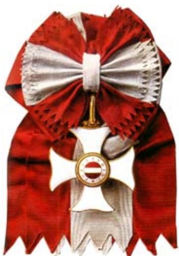
Obrázok 8: Rad Márie Terézie

z Uhorska, lebo len v 15 uhorských peších a 12 husárskych plukoch straty predstavovali viac ako 120-tisíc mužov.