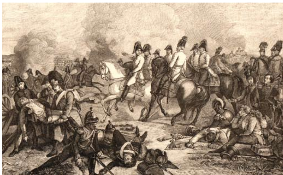
Obrázok 6: Bitka pri Asperne v roku 1809

Vojenské zaneprázdnenie Francúzska v partizánskej vojne v Španielsku považovalo Rakúske cisárstvo za vhodnú príležitosť na posilnenie svojho vplyvu v Európe, a tým aj na obnovenie vojny s Francúzskom. Viedenský dvor rátal s tým, že bude nasadených 12 armádnych zborov: 8 na nemeckom úseku, 3 na talianskom smere a 1 v Poľsku. Vojna sa začala 14. apríla 1809 vpádom 175-tisícovej habsburskej armády na čele s arcikniežaťom Karolom do Bavorska. Napoleon sa však za neuveriteľne krátky čas presunul do južného Nemecka a 19. apríla medzi Landshutom a Regensburgom prinútil v bojovej zrážke habsburskú armádu na ústup. Dňa 22. apríla Francúzi zvíťazili v bitke pri Eggmühle a už im nič nestálo v ceste na Viedeň. Hlavné mesto monarchie obsadili bez boja 13. mája 1809, no vojna sa tým neskončila. Napoleon sa pokúsil prekročiť Dunaj, ale pri Asperne sa proti nemu opäť postavil arciknieža Karol, ktorý mal k dispozícii okolo 90 000 vojakov a približne 300 diel.