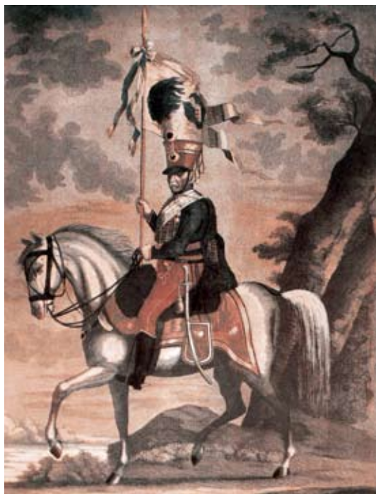
Obrázok 2: Ladislav ŠKULTÉTY z Mojtína

stavníkom bol 54-ročný Ladislav Škultéty z Mojtína, mal začiatkom leta 1792 pred vstupom na bojisko 2 324 mužov a 2 268 koní. Pri súpise na konci roka mal pluk už len 1 298 mužov a 1 163 koní, takže za 6 mesiacov stratil (na padlých, ranených, chorých, zajatých, dezertéroch či nezvestných) takmer polovicu mužstva i koní. Pritom nebojoval v žiadnej väčšej bitke, ale len v menších šarvátkach. Francúzske úspechy pretrhla až bitka pri Neerwindene 18. marca 1793. Na prenikavom víťazstve habsburskej armády sa nemalou mierou podieľali aj uhorské pluky: 33. a 34. peší pluk a Esterháziho (neskôr 3.) husársky pluk. V niekoľkohodinovom boji sa vyznamenali najmä husári, ale v bodákovom útoku aj pešiaci. Mužstvo týchto troch plukov, ktoré v bitke stratili takmer štvrtinu či pätinu mužov, tvorili prevažne Slováci. Tuhé boje však pokračovali aj nasledujúci deň, keď sa zboru pod velením podmaršala Jána Beňovského z Beňova podarilo vytlačiť pozviechané francúzske vojská z Wommersonu a Hackendovenu. Porazený generál Ch. Dumouriez bol obvinený zo zrady revolúcie a gilotíne sa vyhol len dezerciou k habsburskej armáde.